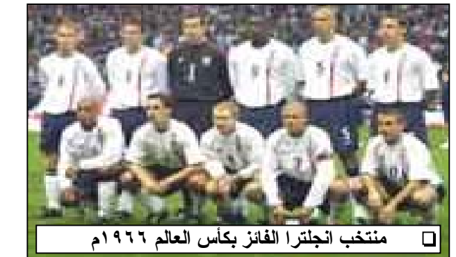
منتخب انجلترا الفائزة بكأس العالم ١٩٦٦ م

الاولى : تالق الدنماركيون وفازوا في مباراتهم الاولى على الارجواي (١/٢) وعادوا ليتعادلوا مع السنغال (١/١) وفي مباراتهم الثالثة اجهزوا على اخر امل لرفاق زيدان