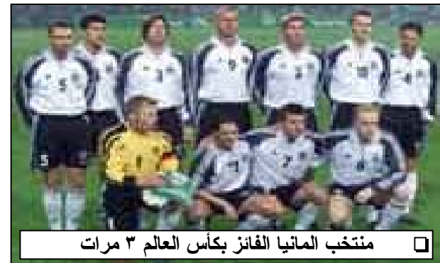
منتخب المانيا الفائزة بكأس العالم ٣ مرات

متصدر المجموعة الرابعة : استطاع الكمبيوتر الياباني التربع على عرش هذه المجموعة بتعادله في افتتاح المجموعة امام بلجيكا (٢/٢) وفوزه على روسيا (١/٠ صفر) واختتم مباراته الثلاث بفوز مستحق على تونس (٢/٠ صفر) ليجمع ٧ نقاط ويتصدر ليقابل منتخب تركيا فاني المجموعة الثالثة.. وتبدو فرصة اليابانيين جيدة لبلوغ دور الثمانية ولأول مرة في تاريخهم.