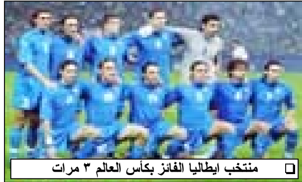
منتخب ايطاليا الفائزة بكأس العالم ٣ مرات

لانه اهداهم التاهل على طبق من ذهب عندما فاز على منتخب كرواتيا ١/٠ صفر وفاز للطلين ليزيمتهم امام الكروات (٢/١) وقدم خدمة لهم بفتح شبابه لهم مرتين (٢/٢ صفر) وتعادلهم الاخير امام المكسيك بهدف المنقذ دبل بيرو ليصعدوا ويقابلوا منتخب كوريا الجنوبية