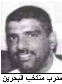
مدرب منتخب البحرين